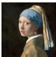
© Mauritshuis, The Hague - La jeune fille à la perle de Vermeer

GRATUIT • ACCÈS LIBRE 10H ➡ 12H ET 14H ➡ 17H