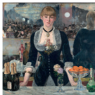
© The Courtauld - Un bar aux Folies- Bergères d'Edouard Manet

GRATUIT • ACCÈS LIBRE 10H ➡ 12H ET 14H ➡ 17H