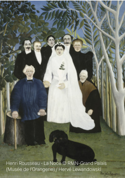
Henri Rousseau - La Noce