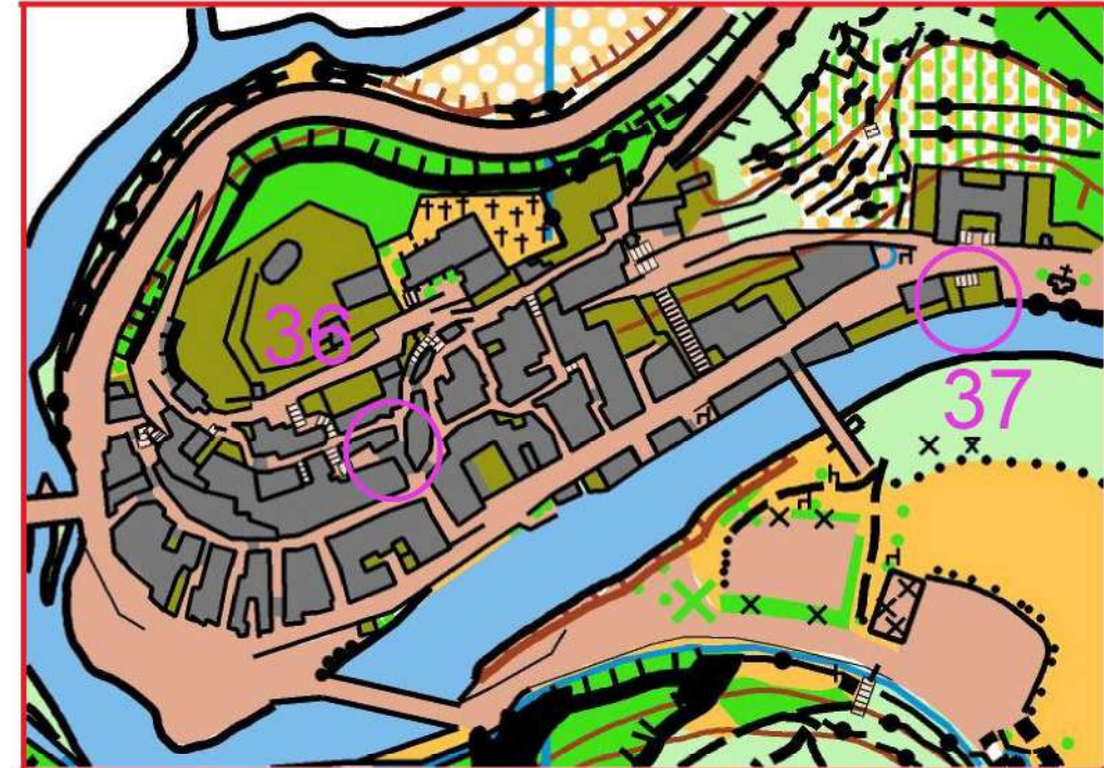
Loupe Echelle 1/1000