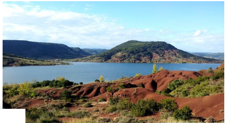
Lac du Salagou

Engagé dans une démarche de développement durable, le Parc s'attache à la découverte et la connaissance des patrimoines, de la culture et de l'identité du territoire .